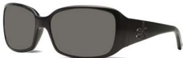
CK3065S 070 BLACK