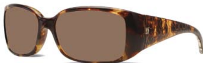
CK3066S 004 HAVANA