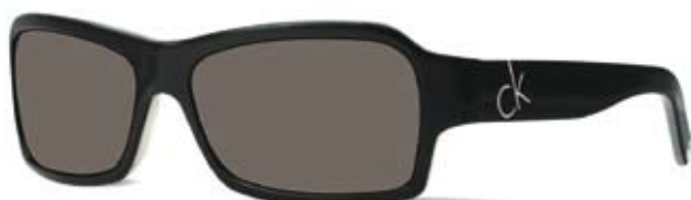
CK4062S 222 BLACK

NABESTELLINGEN KUNNEN WORDEN BESTELD BIJ MARCHON BENELUX OP GRATIS NUMMER 00800 7200 2020 OF PER EMAIL VIA BENELUX@MARCHON.COM