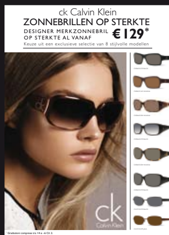
POSTERS & COUNTERCARD

Om extra aandacht te vestigen op het ck 'zonnebrillen op sterkte' programma, kunt u de twee posters op A1-formaat, in uw etalage of stoepbord plaatsen. De countercard op A4-formaat kunt u plaatsen bij de display op de toonbank of in de etalage.