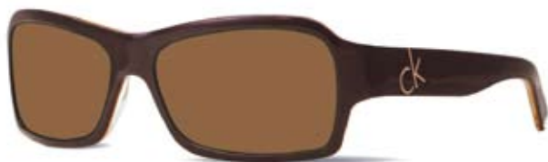
CK4062S 263 HAVANA