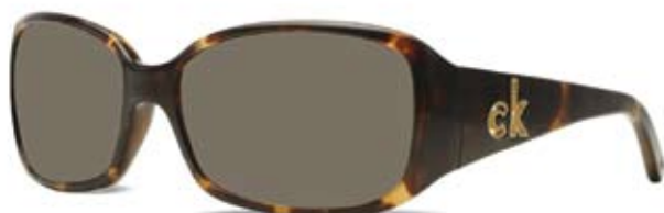
CK3065S 004 HAVANA