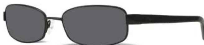
CK1072S 070 BLACK