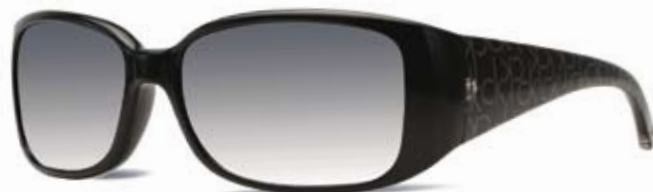
CK3066S 070 BLACK