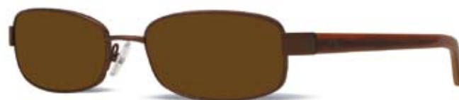
CK1072S 039 JAVA

EEN DESIGNER MERKZONNEBRIL OP STERKTE VANAF